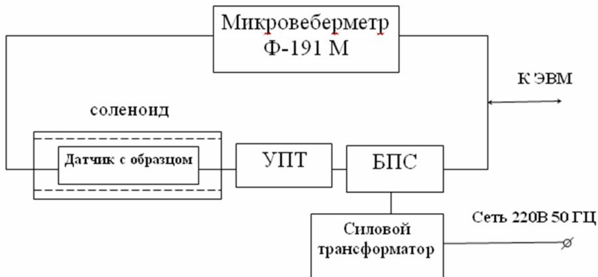
Рис. 2. Структурная схема установки измерения магнитных параметров герконов.

На рис. 3 в качестве примера показана предельная петля и ее параметры для геркона МКА-14103. Параметры петли измерены в единицах системы СГС.